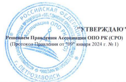
ТАБЕЛЬ проведения плановых проверок за деятельностью членов Ассоциации ОПО РК (СРО) на 2024 год (1 раздел)